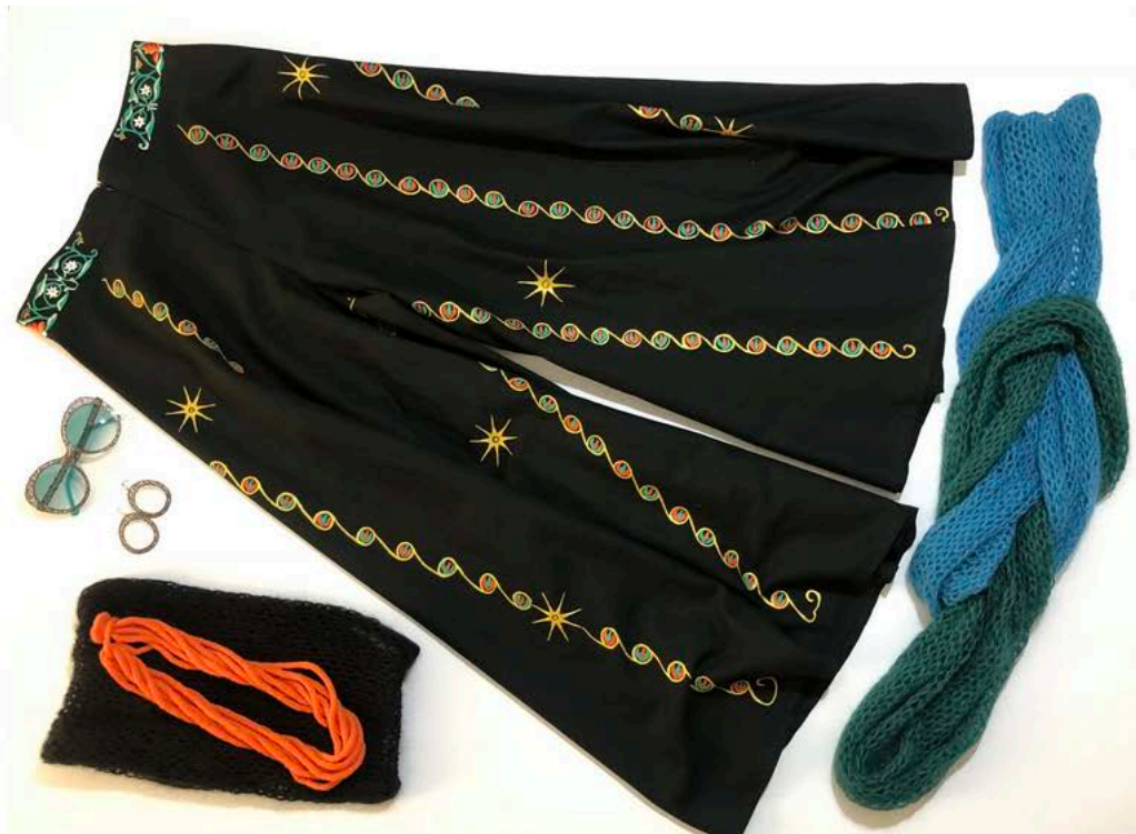
Pantaloni: Eutopia Sciarpe - collane: MEM Occhiali - orecchini: Lio