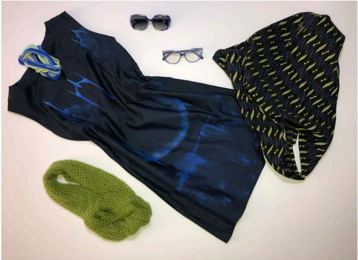
Abito: Eutopia Borsa - collana - sciarpa: MEM Occhiali: LAMARCA