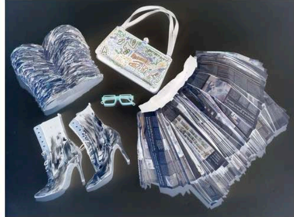
Corsetto - gonna - oc- chiali: Lio Stivaletti - borsa: Simon Cracker